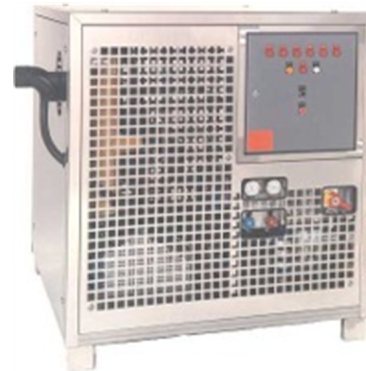
... in industrieller Ausführung.