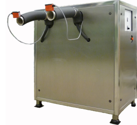
Eisbereiter mit Steuerung und Edelstahlgehäuse...