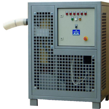
... in industrieller Ausführung.